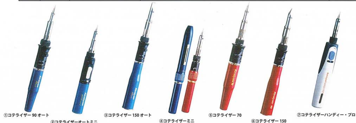
①コテライザー 90 オート