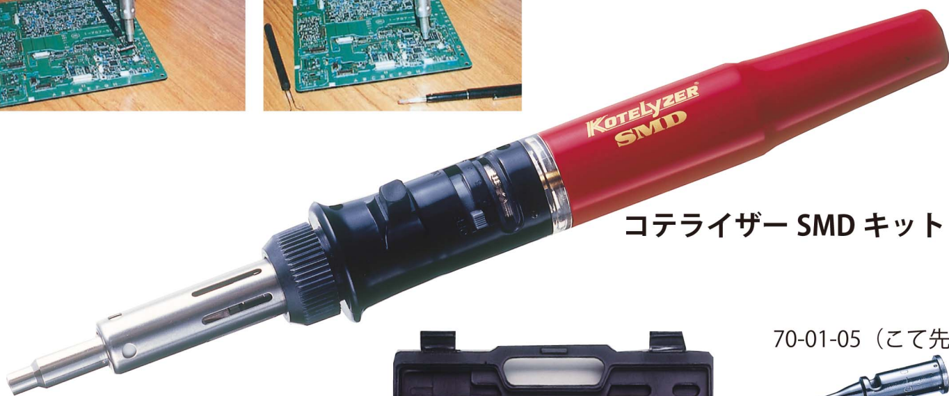
コテライザー SMD キット